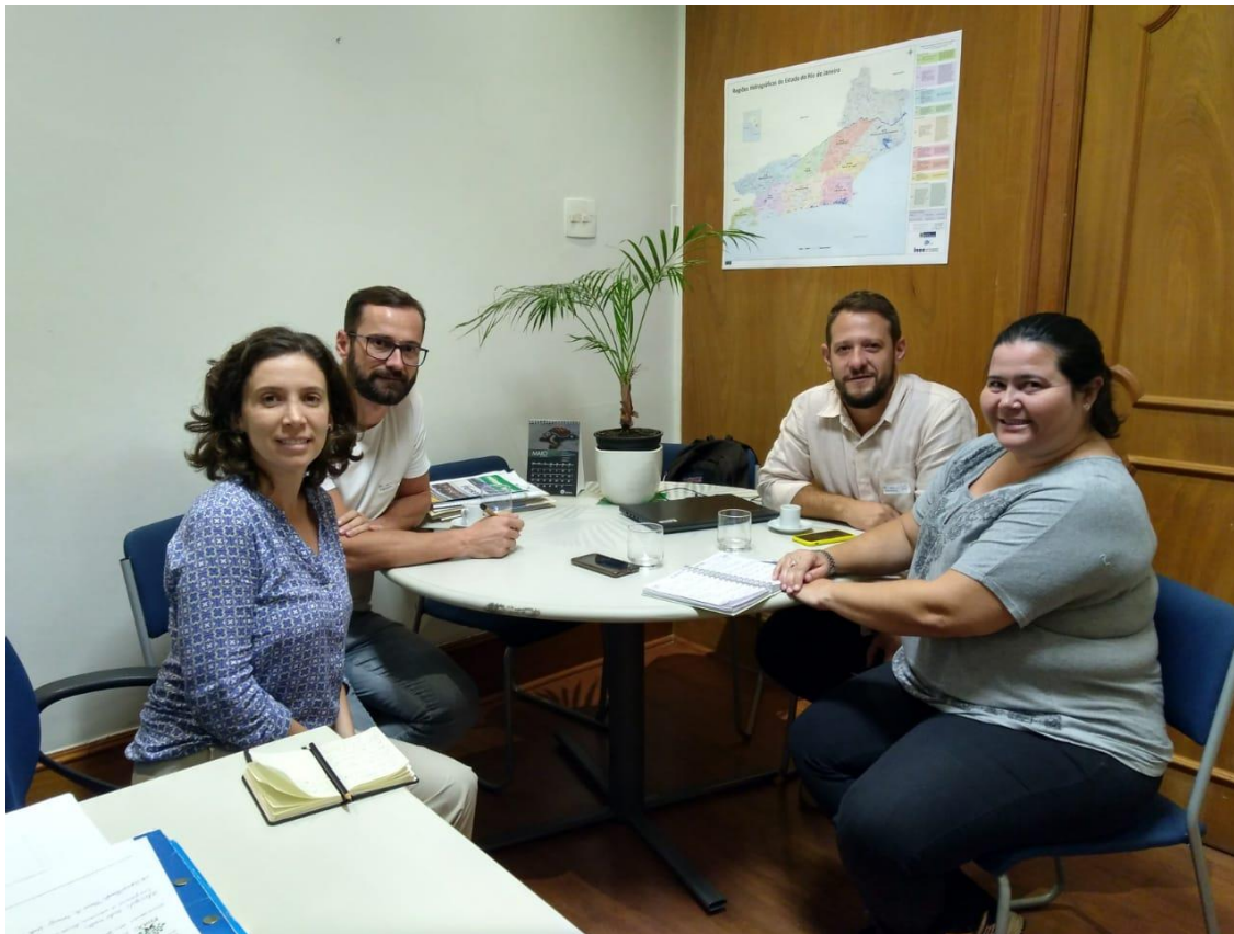
Figura 2: Reunião na Secretaria de Estado do Ambiente e Sustentabilidade do Rio de Janeiro – SEAS

A partir de agora a SUBCON, em conjunto com o Núcleo Planejamento de Ações do JBRJ, irão avaliar as ações de conservação do PAN Endêmicas do Rio que podem ser direcionadas para o município de Itaocara, por intermédio do projeto Pró-Espécies. Dentre as ações elencadas no PAN para a região estão a substituição de espécies exóticas invasoras, a restauração florestal buscando a conectividades entre os remanescentes de vegetação e o fortalecimento da prevenção, fiscalização e combate às queimadas. Já a secretaria de Itaocara irá elaborar um projeto de restauração e contará com o apoio técnico de integrantes do INEA e da SEAS. Neste contexto, está sendo agendado a visita de Thiago e algum representante da SUBCON ao Programa “Replantando Vida” da Companhia Estadual de Águas e Esgotos do Rio de Janeiro - SEDAE ( https://www.cedae.com.br/programareplantandovida ), cujo objetivo será conhecer e verificar a possibilidade de estabelecer uma parceria para receber as mudas necessárias para o projeto de restauração em Itaocara. Neste programa, os apenados