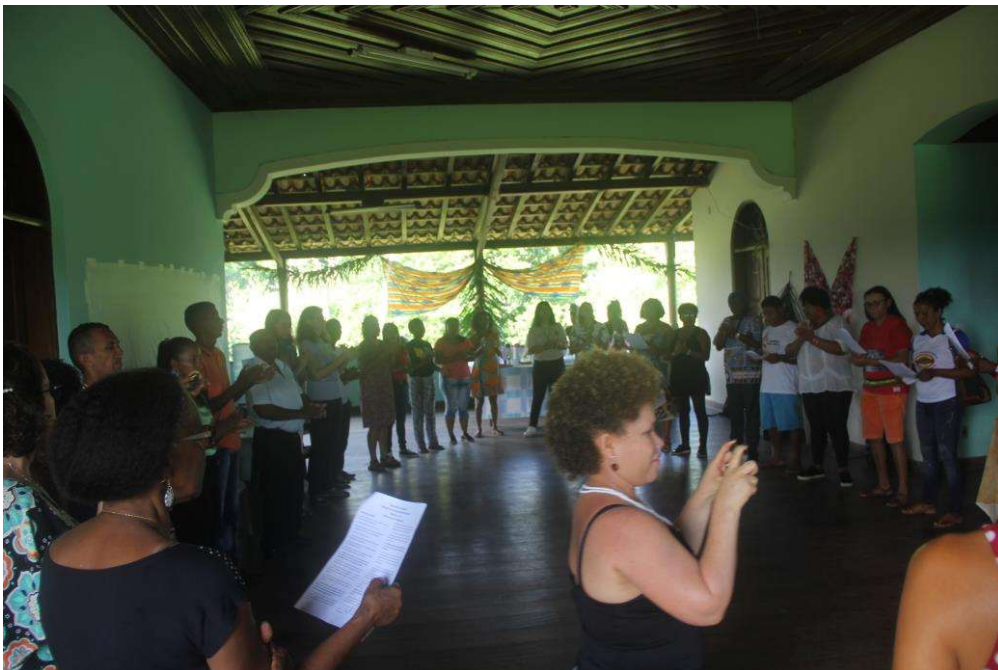
Figura 2. Momento de Abertura da Oficina.