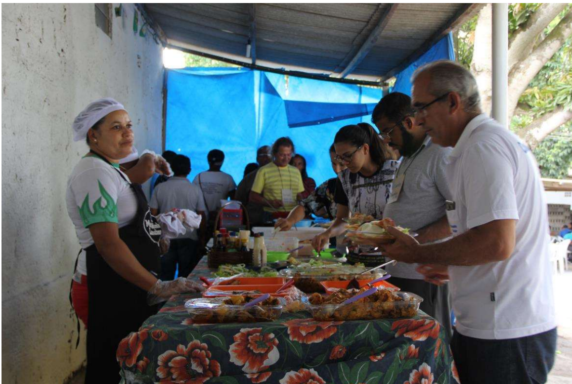
Figura 24. Momento das refeições.