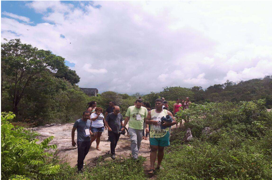
Figura 27. Grupo realizando a visita de campo.