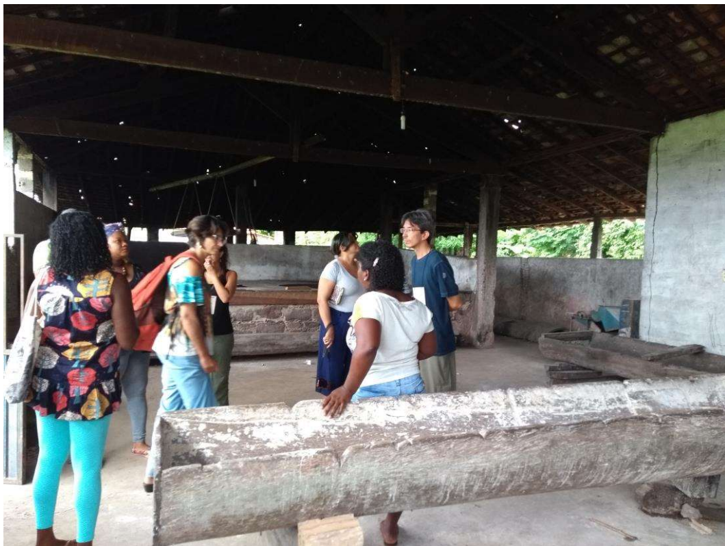
Figura 10. Grupo na visita de campo.