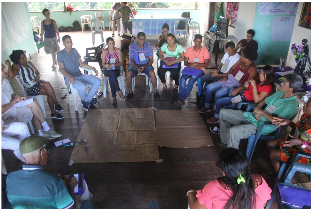
Figura 6. Trabalhos em grupos .