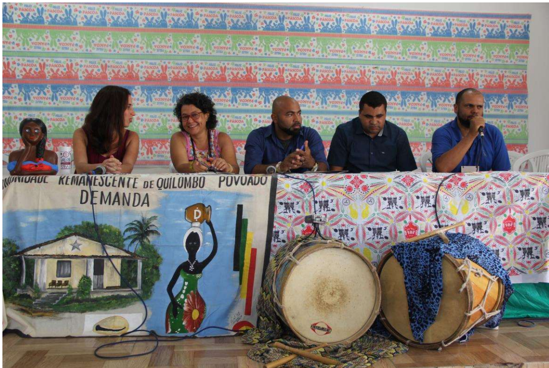
Figura 23. Mesa de Abertura da Oficina.