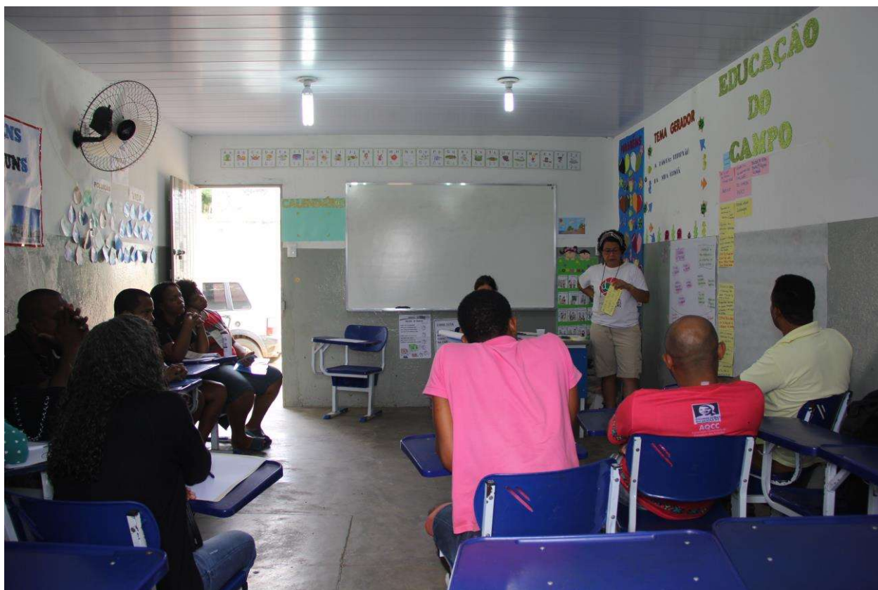
Figura 26. Trabalhos em grupos.