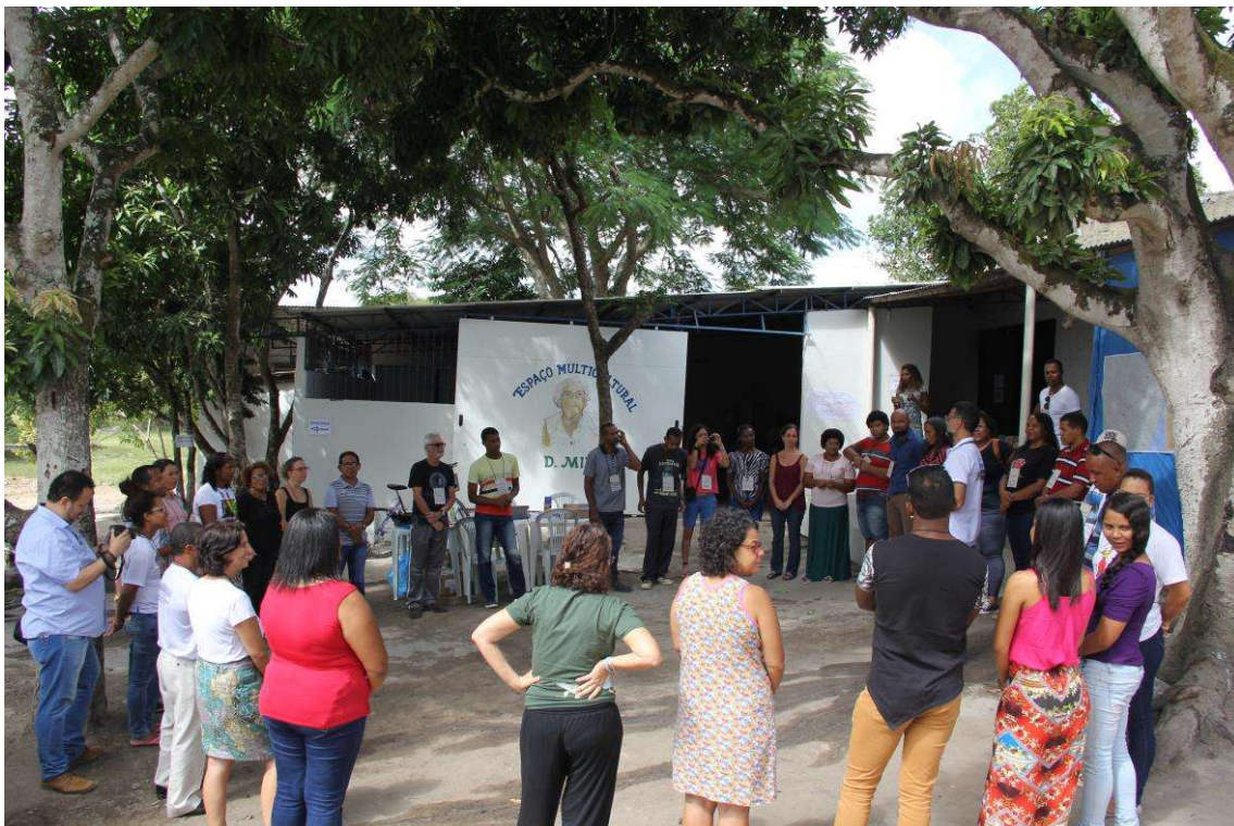
Figura 22. Abertura da Oficina.