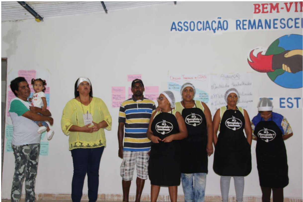
Figura 29. Momento de avaliação e agradecimentos da equipe organizadora da comunidade sede.