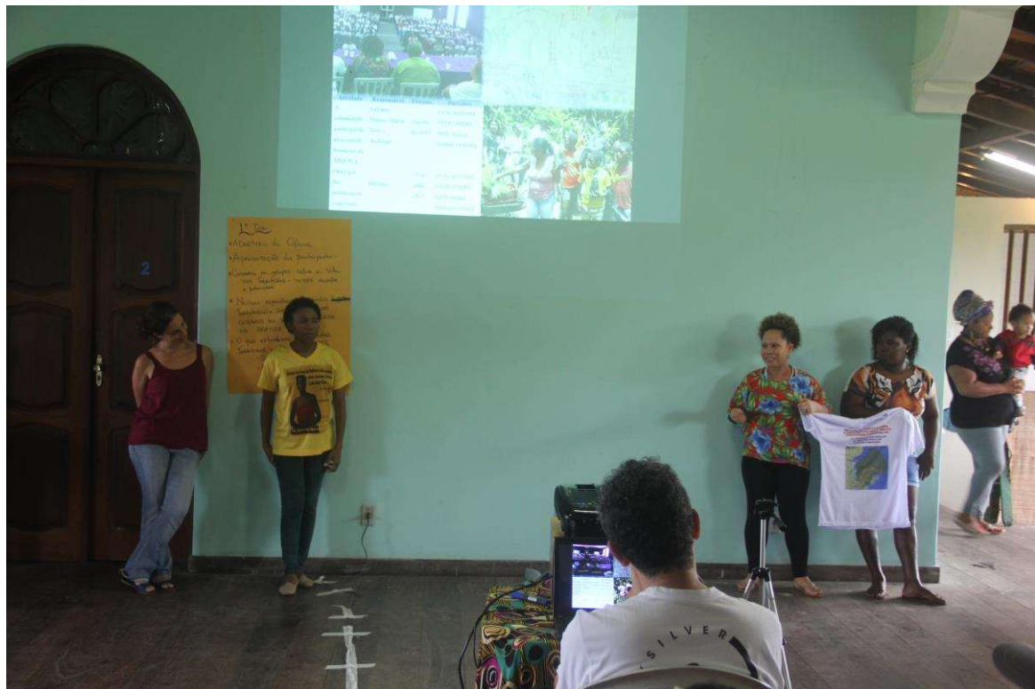
Figura 8. Apresentação dos projetos de gestão apoiados pelo MMA.