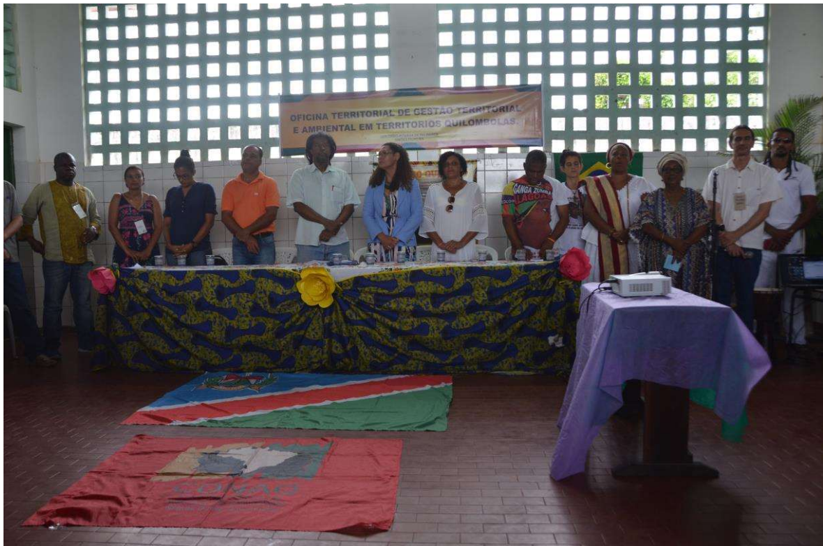
Figura 33. Mesa de diálogo com governo.