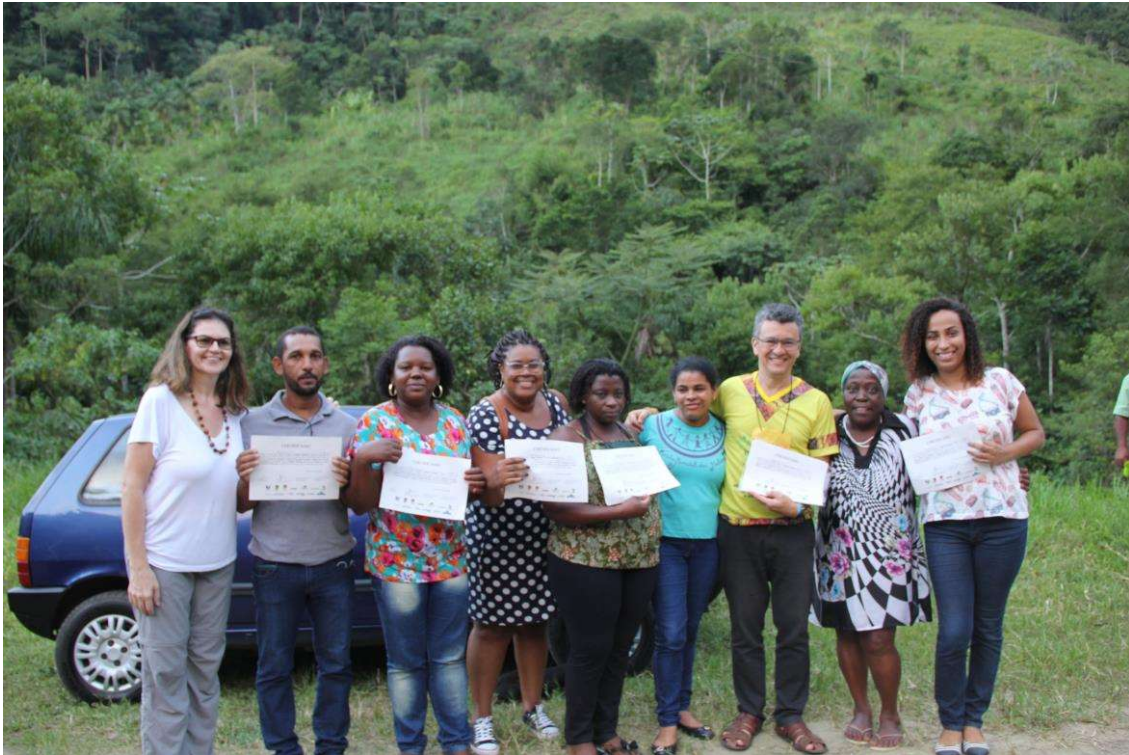
Figura 21. Entrega dos Certificados.