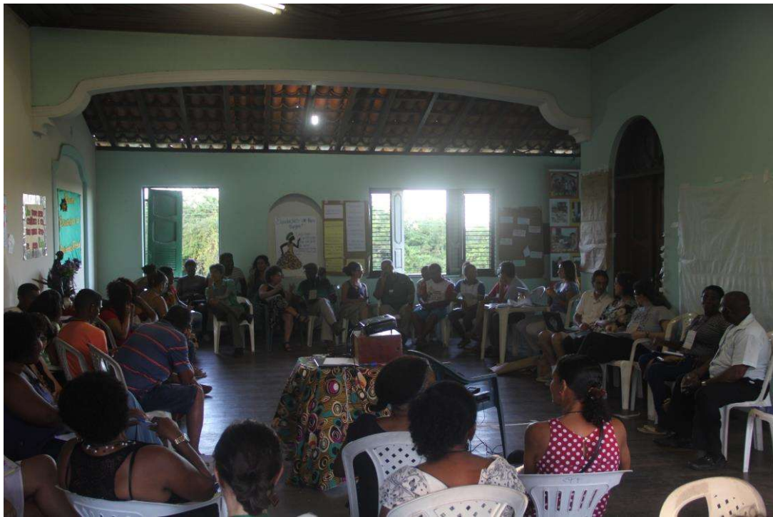
Figura 7. Momento de conversa sobre a PNGATI