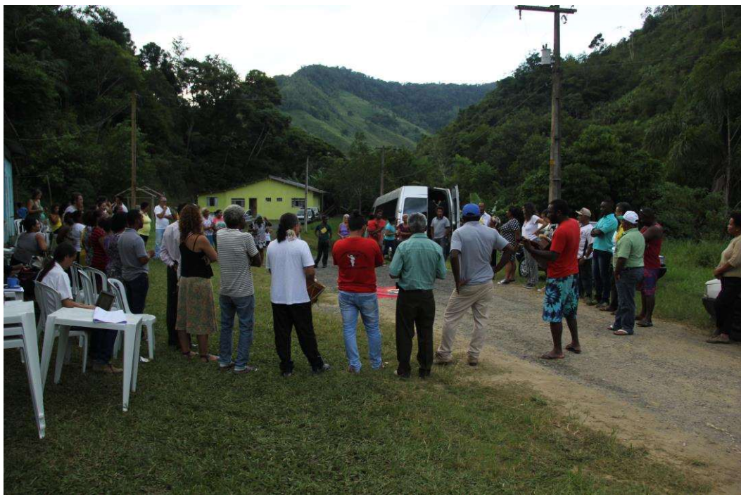
Figura 20. Momento de avaliação final da Oficina.