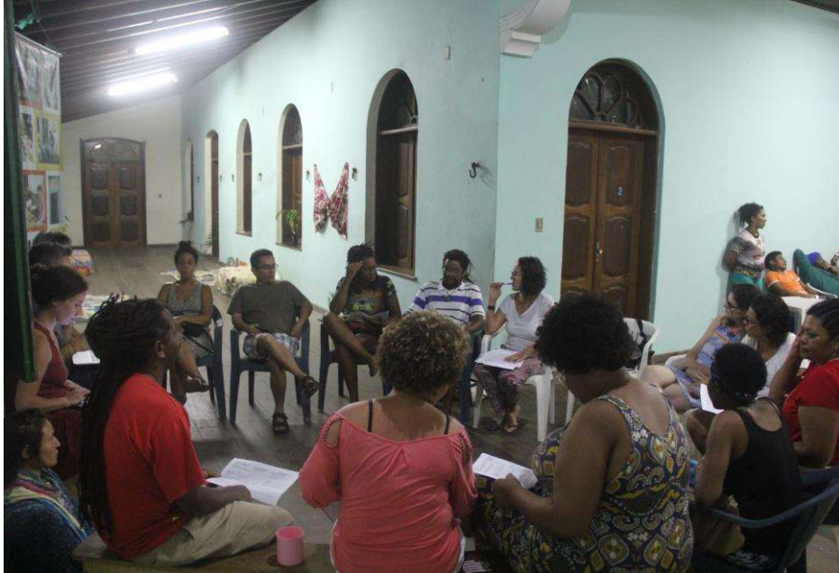
Figura 1. Reunião previa com a comunidade sede para combinados dos três dias da oficina.