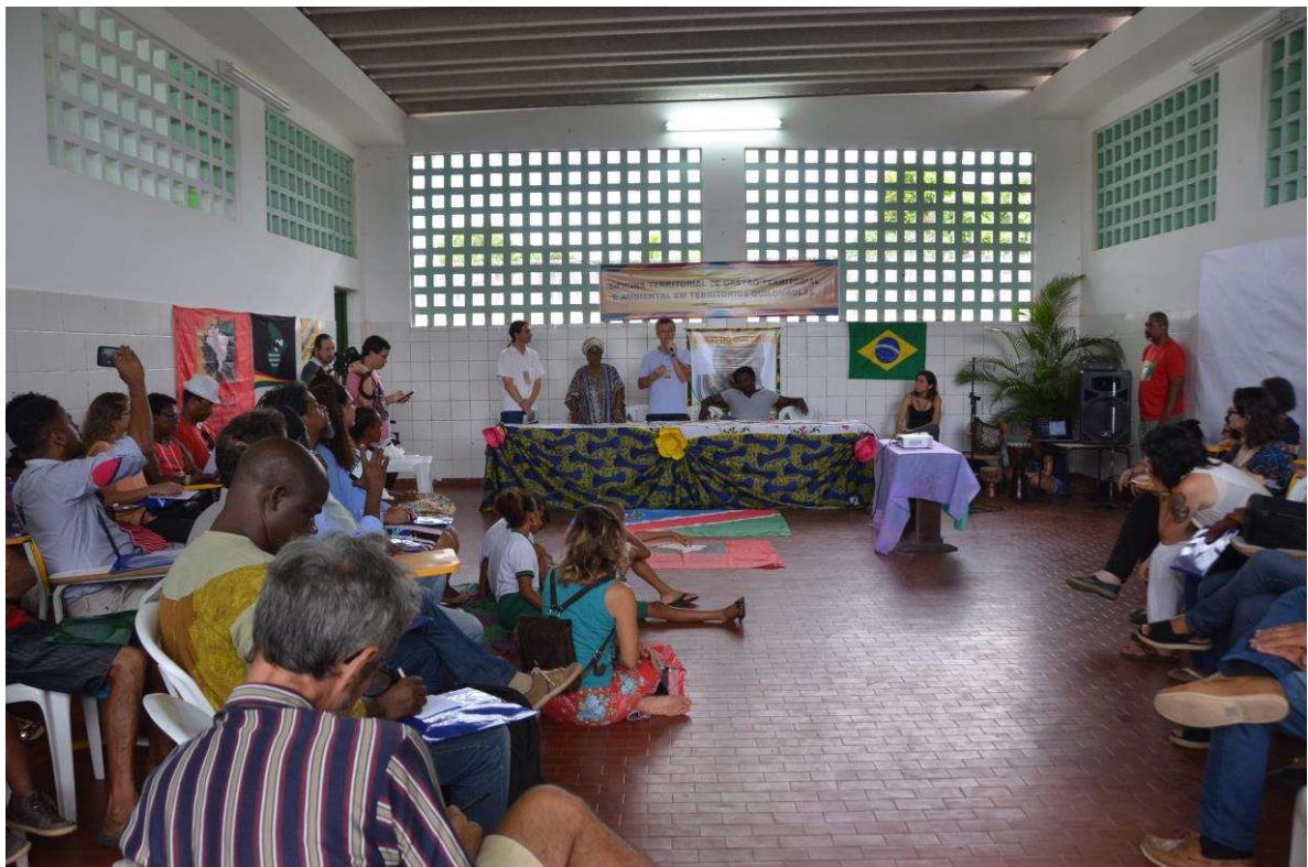
Figura 32. Mesa de Abertura da Oficina.