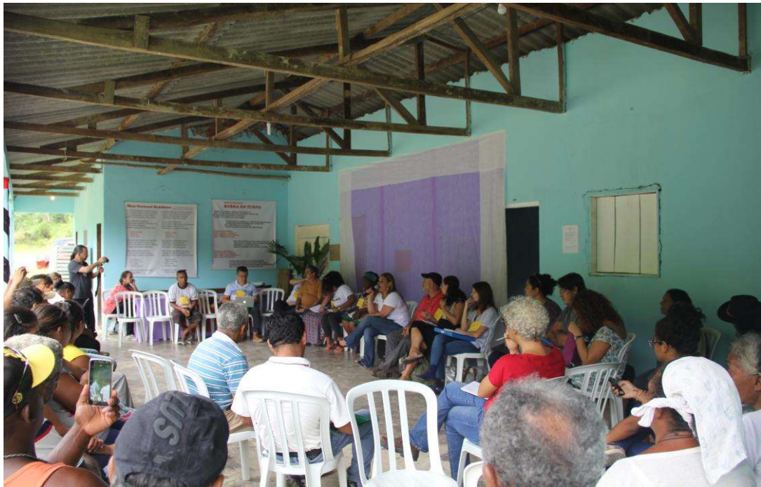
Figura 16. Mesa de abertura coordenada pela comunidade.