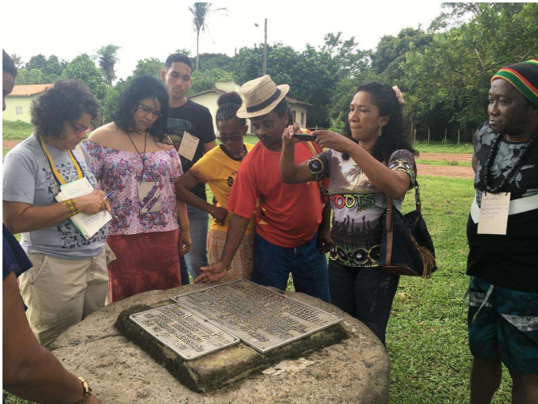
Figura 9. Grupo na visita de campo.