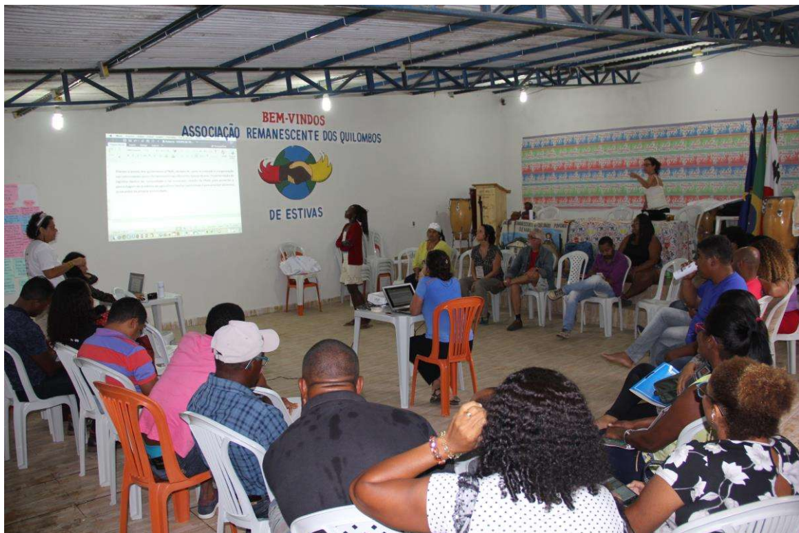
Figura 28. Apresentação das proposições para GTAQ.