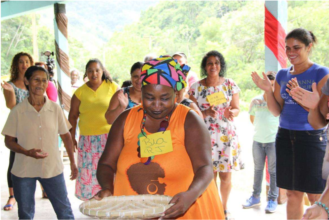
Figura 15. Dinâmica da farinhada para apresentação dos participantes por Estado.