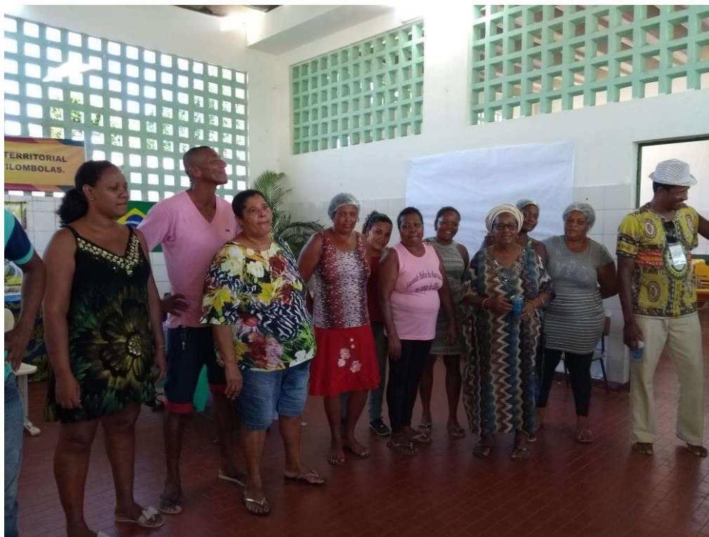
Figura 39. Equipe de trabalho da comunidade fazendo agradecimentos e avaliação.