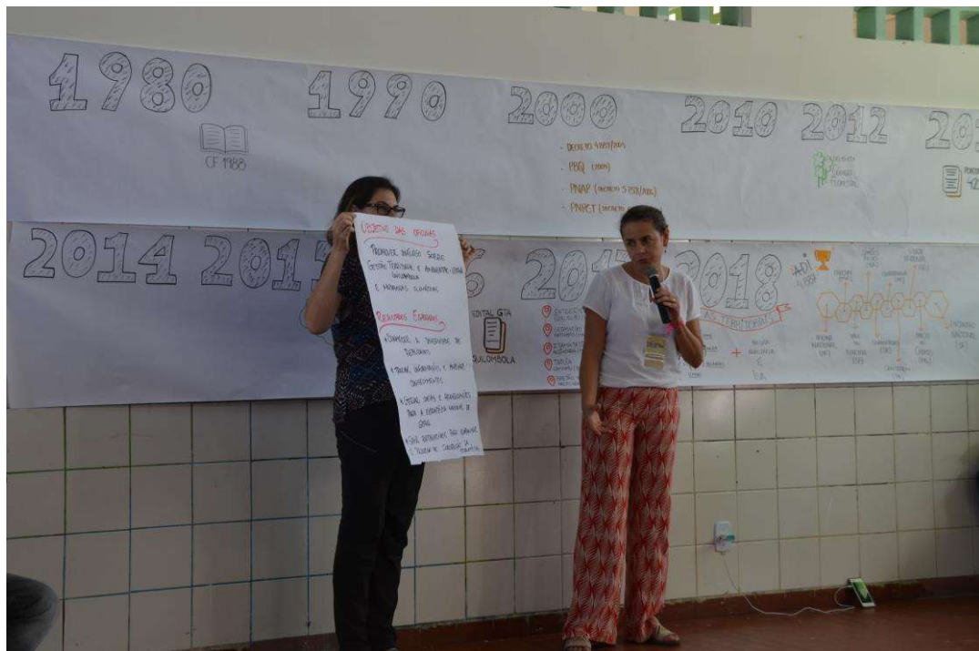
Figura 34. Apresentação dos objetivos e programação da oficina.