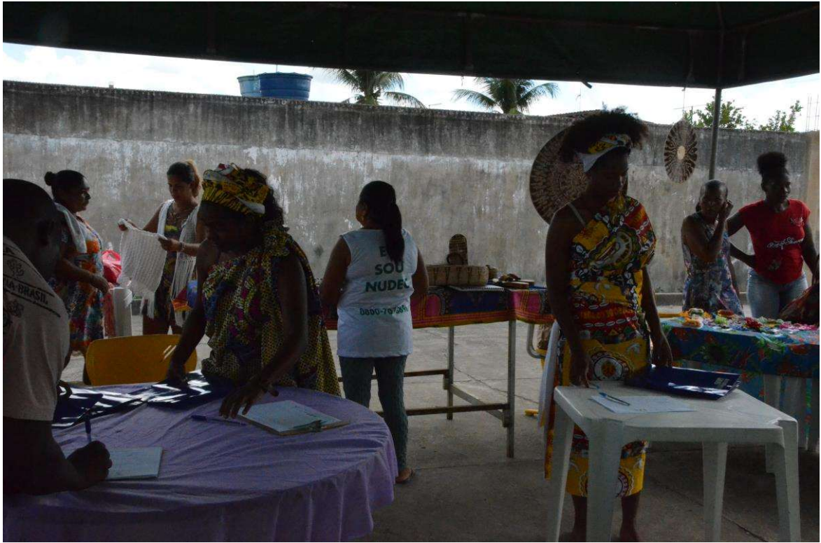
Figura 31. Mesa de inscrições e distribuição do material.