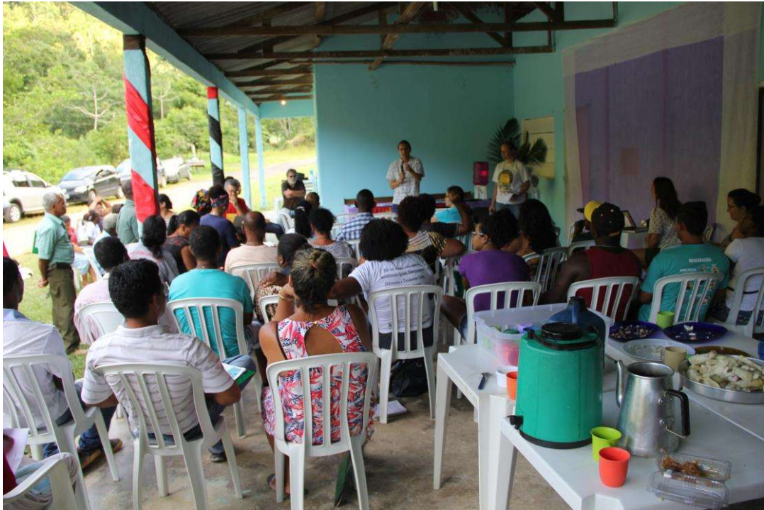
Figura 19. Apresentação dos destaques das visitas de campo.