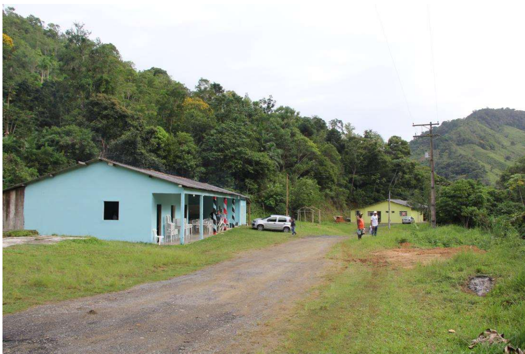
Figura 13. Centro comunitário de Ribeirão Grande.