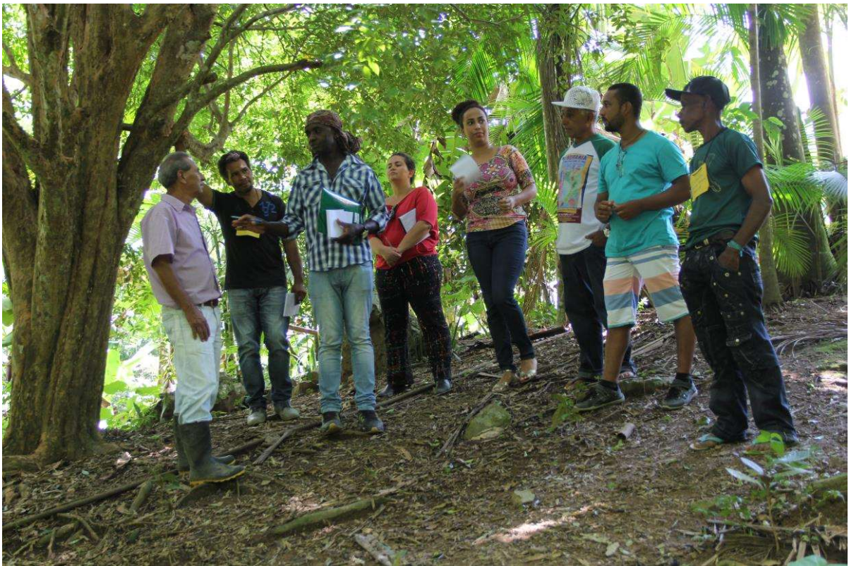
Figura 18. Grupo de trabalho em visita de campo.