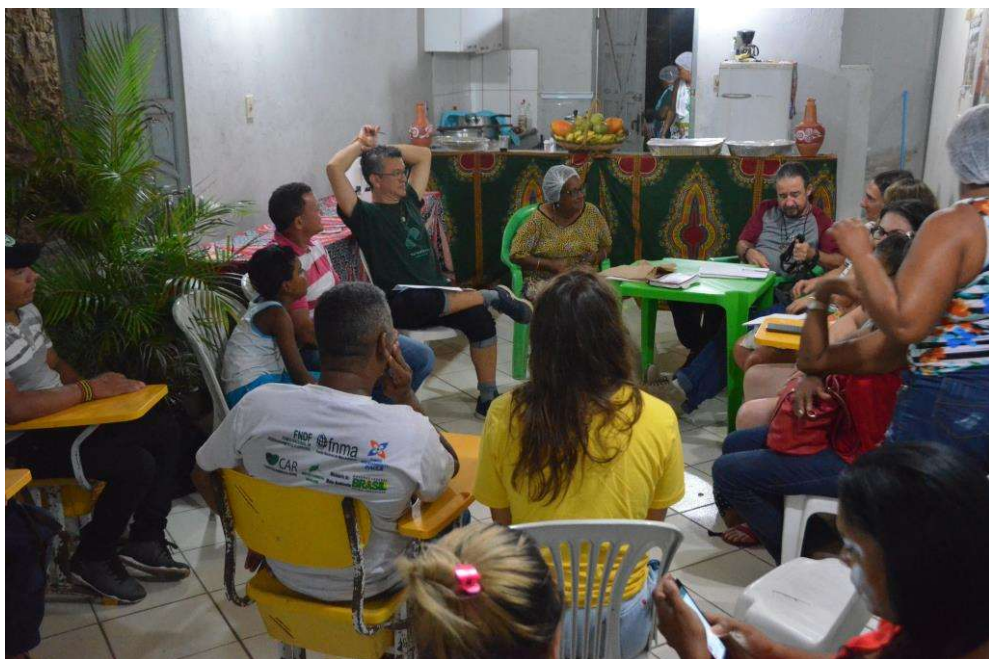
Figura 30. Reunião preparatória com a coordenação da associação de Pitanga.