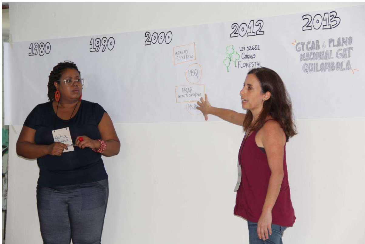
Figura 25. Construção da Linha do Tempo.