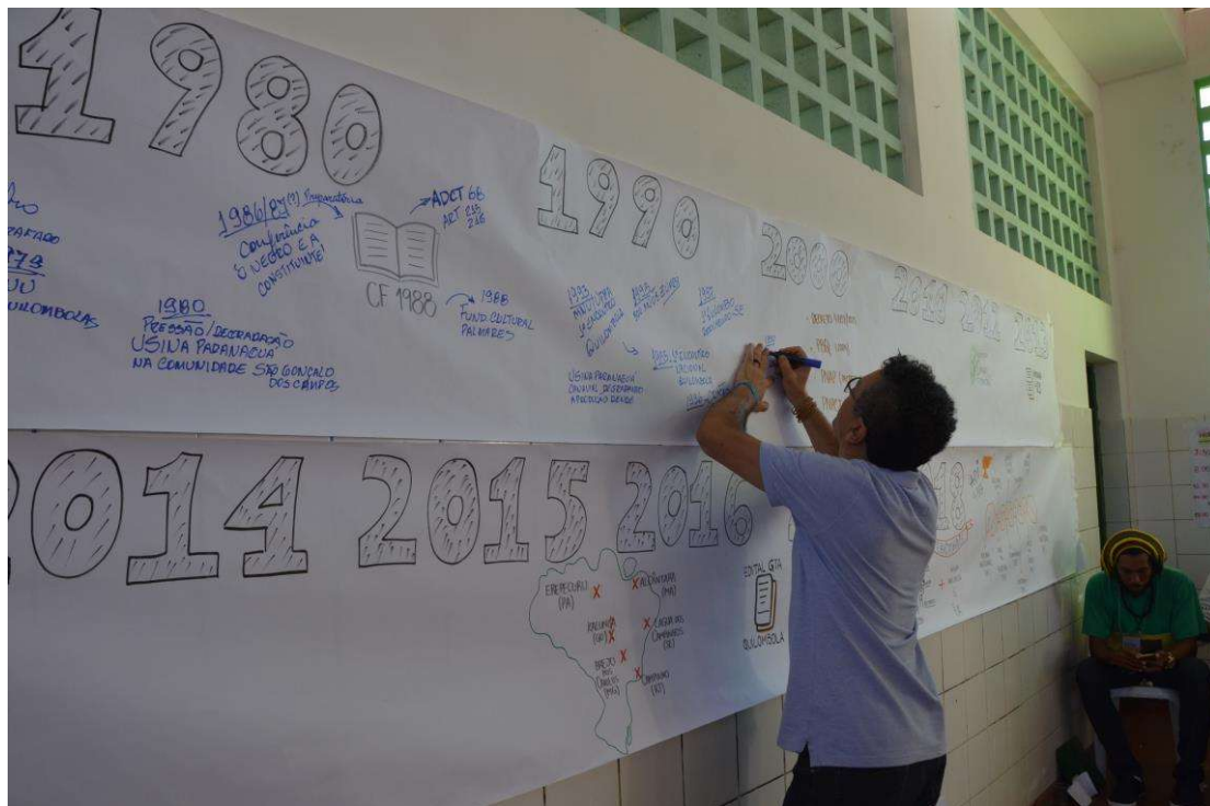
Figura 35. Construção da Linha do tempo.