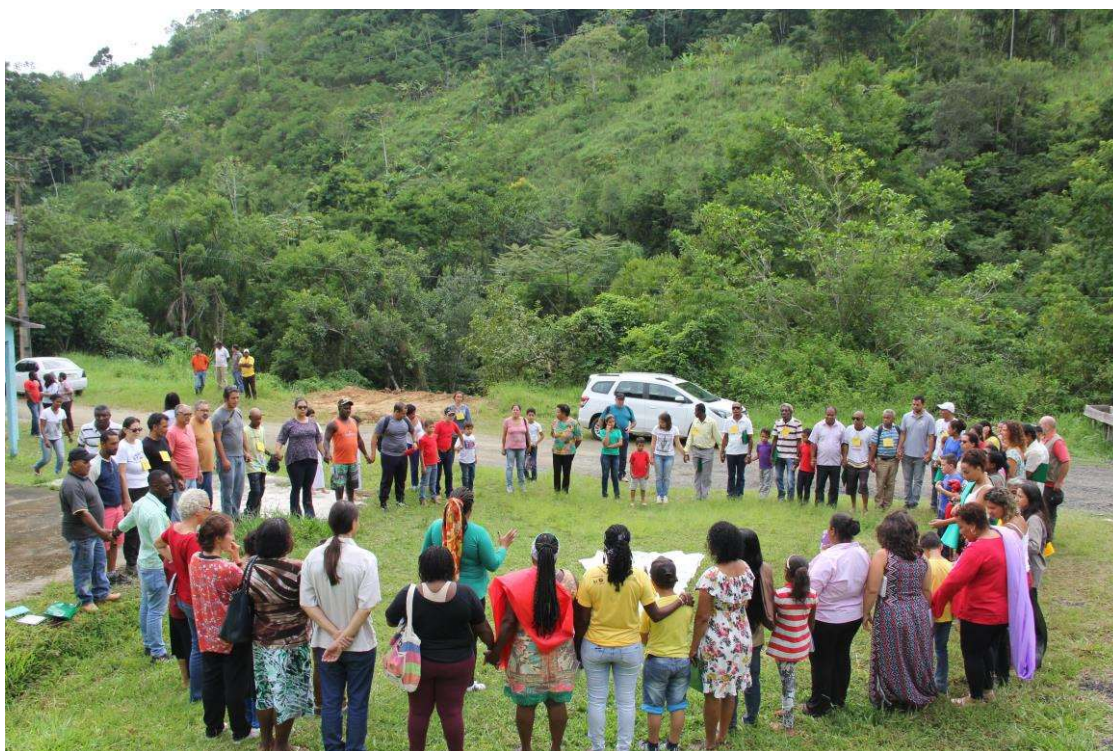
Figura 14. Momento da abertura da oficina.