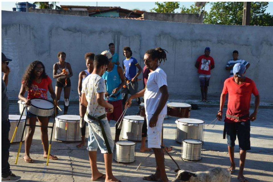
Figura 38. Momento de fechamento com apresentação de tambores pelos jovens da comunidade.