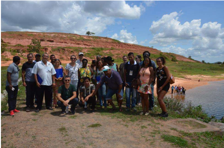
Figura 37. Participantes na visita de campo.