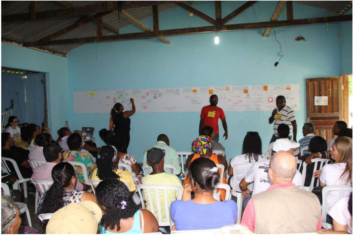
Figura 17. Construção da Linha do tempo coordenada pela CONAQ.