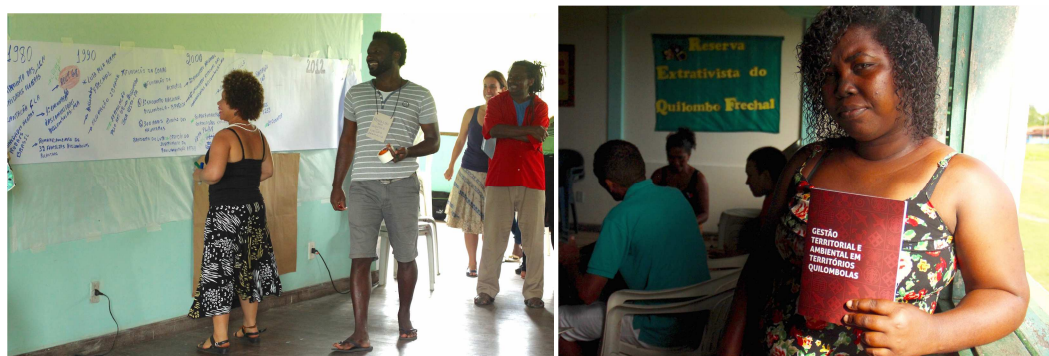
À ESQ: CONAQ CONSTRÓI PAINEL COM A LINHA DO TEMPO; À DIR: CARTILHA ELABORADA COM BASE NO PRIMEIRO CICLO DE OFICINAS SOBRE GTAQ

Após a linha do tempo que apresentou o histórico do movimento quilombola e os passos que resultaram nas Oficinas sobre Gestão Territorial Ambiental Quilombola (ver abaixo), o Instituto Socioambiental (ISA) apresentou seu histórico de atuação e comprometimento com a defesa dos direitos coletivos de povos e comunidades tradicionais no Brasil desde sua fundação, em São Paulo, em 1994. Além da parceria com povos indígenas do Rio Negro, com povos indígenas e comunidades ribeirinhas da Bacia do Rio Xingu, o ISA atua em parceria com as comunidades quilombolas do Vale do Ribeira.