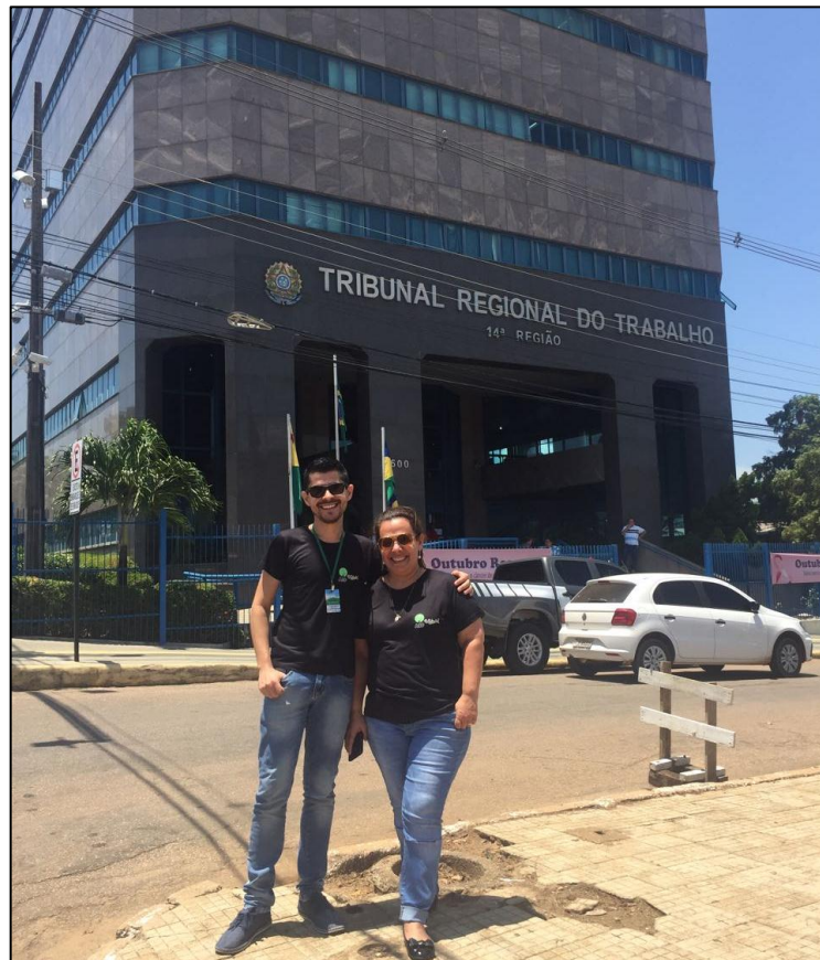
Cândido Mota (SP), 19 de outubro de 2017.