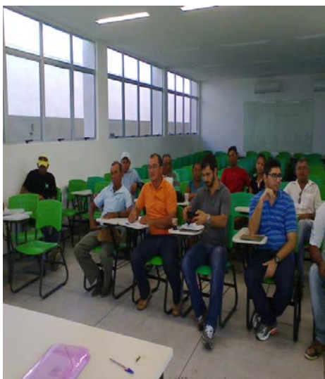
Reunião – Conselho Municipal de desenvolvimento Rural Sustentável