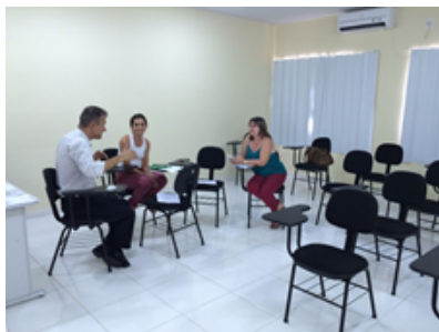
Oficina para Capacitação de Gestores de Negócio de Turismo