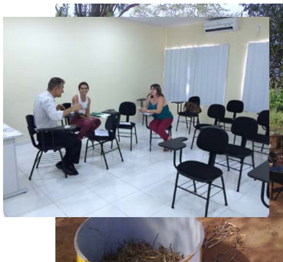
Dia de Campo - Silagem