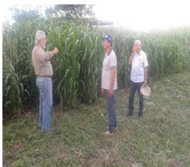
Visita Pesquisador Instituto Agrônômico de Pernambuco