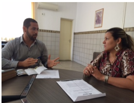
Reunião com a Secretaria de Educação de Piranhas