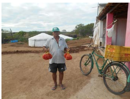
Produtor Rural com colheita de tomate cereja produzido com apoio de tecnologias sociais