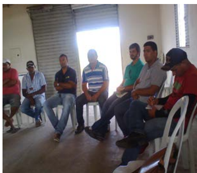
Reunião – Conselho Municipal de Desenvolvimento Rural Sustentável