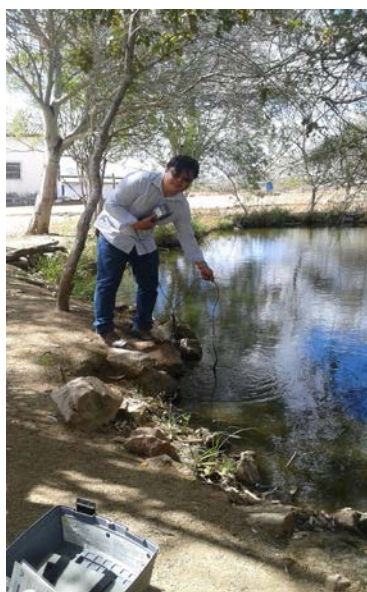
Curso de Piscicultura – Aula prática – Qualidade da Água