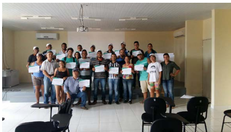
Curso de Piscicultura – Entrega de certificados