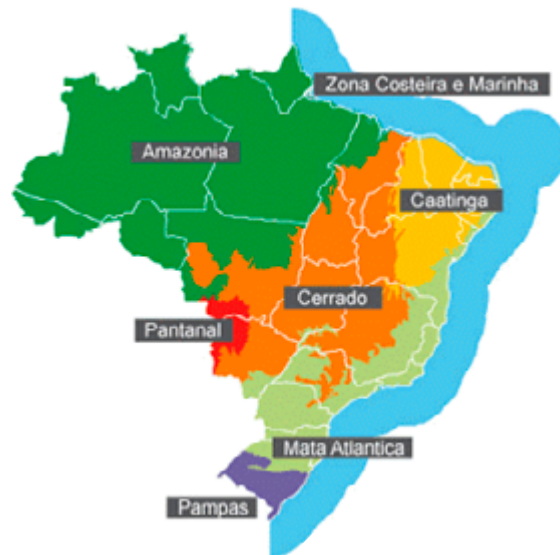
Figura 1: Distribuição geográfica dos biomas brasileiros.