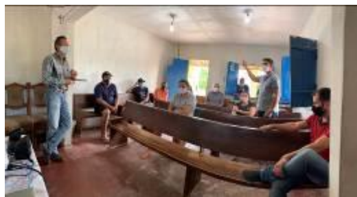
Reunião com técnicos e Associados