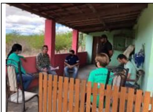
Reunião com técnicos e Associados