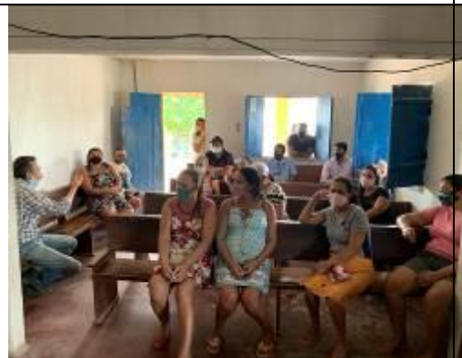
Reunião com técnicos e Associados –