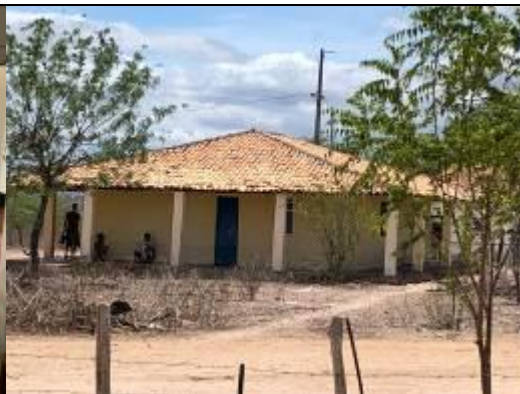
Vista parcial da agrovila – Casa sede antiga