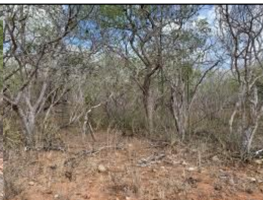
Área de Manejo