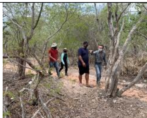
Reconhecimento da Área de Manejo