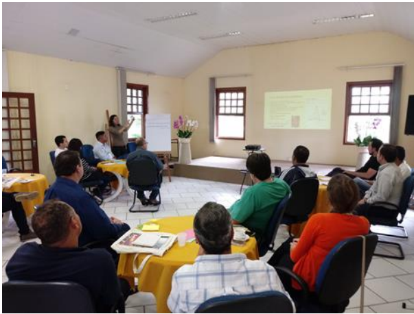
Figura 19. Apresentação sobre a importância da comunicação interna dentro das empresas.

interna nas empresas, bem como sua relevância como instrumento para reduzir conflitos do ponto de vista trabalhista e dos processos produtivos (Figura 19).