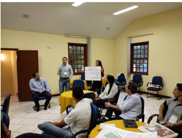
Figuras 12 e 13. Para a melhor compreensão de medidas para que os atributos sejam controlados na cadeia, foi realizada uma atividade em grupos, na qual cada um recebia uma demanda de um cliente que deveria ser garantida por meio de um sistema de controle elaborado por eles.

Como 4 das 5 empresas participantes possuem certificação florestal em áreas próprias, a discussão teve muita participação (Figuras 12 e 13). Dúvidas sobre os sistemas de controle, atributos e até mesmo do FSC foram esclarecidas pela especialista. Os participantes também apresentaram sugestões e críticas ao sistema de certificação e discutiram de que forma poderiam implantar melhorias em seus próprios sistemas de controles.