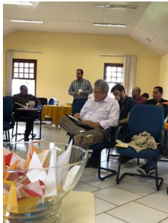
Figura 34. Finalização das atividades, em que foram relatados nos Origamos produzidos durante o evento, os sentimentos envolvidos ao longo do Workshop.

Ao final das atividades, os participantes foram convidados a escreverem nos origamis elaborados anteriormente, durante o Painel 01, um aprendizado e um sentimento que levavam do Workshop (Figura 34). As palavras sintetizam os acontecimentos dos três dias de workshop e estão apresentadas abaixo: