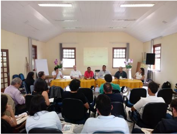
Figura 22. A sala foi organizada em plenária para que um mesa de debate fosse colocada a frente. Um representante de cada empresa foi convidado para debater os desafios e intenções de avanço na área de tecnologia que melhoram o desempenho socioambiental e financeiro das empresas.

Em seguida, foi realizada uma dinâmica “world café”, na qual os participantes separados em mesas discutiam sobre “como desenvolver tecnologias conjuntamente” e “como o governo pode promover tecnologias na siderurgia” (Figuras 23 a 26).