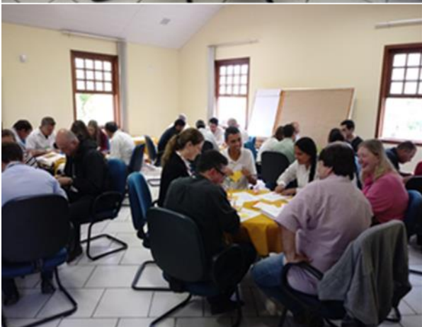
Figuras 07 e 08. Grupos realizando a atividade. Durante a discussão dos resultados obtidos, uma observação realizada foi sobre a importância dos treinamentos para consolidar a forma de realizar as atividades.