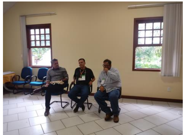
Figura 29. A dinâmica “dança das cadeiras” permitiu que se expandisse a discussão sobre o tema, considerando a seguinte temática: como a siderurgia colabora ou pode colaborar com Agenda Global.

Devido ao nível de entrosamento dos participantes nesse momento do evento, foi identificado que houve grande troca de conhecimentos, não só entre as empresas, mas também entre as diferentes áreas. Muito além da discussão em si, a atividade promoveu abertura dos responsáveis pela área de tecnologia e de gestão da qualidade para outras percepções. Mais tarde, em feedback feitos por participantes ressaltaram como um dos principais resultados teria sido as trocas realizadas e que segundo eles “nunca teriam sido tão boas”.