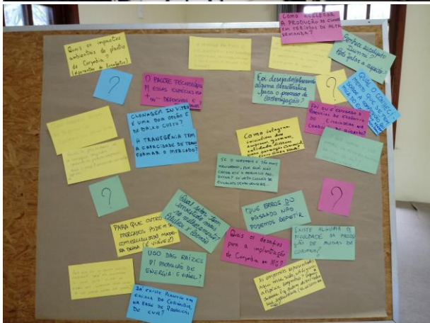
Figuras 30 e 31. Discussão sobre a produção de material genético para formação de florestas energéticas.