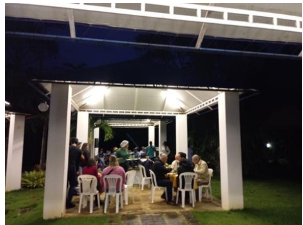
Figuras 14 e 15. Confraternização entre os participantes do Workshop, em que foi priorizado a utilização de ingredientes produzidos localmente, como também a apresentação da Orquestra de viola de Martinho de Campos, patrocinada pela empresa ArcelorMital.