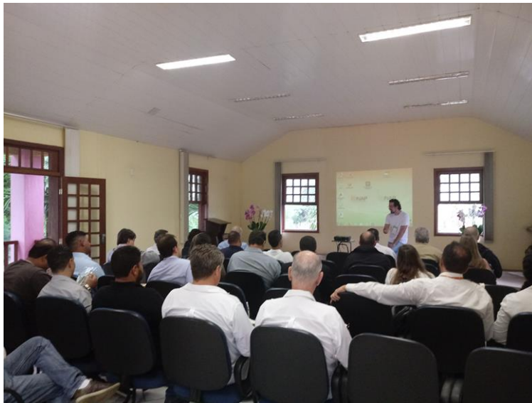
Figura 3. Apresentação dos objetivos e da agenda do Workshop

Posteriormente, houve uma apresentação do representante do Ministério da Ciência, Tecnologia, Inovações e Comunicações (MCTIC) (Figura 04).