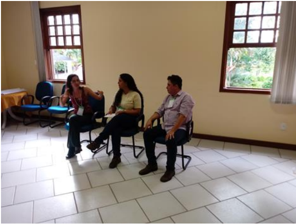
Figuras 28. Discussão sobre a Agenda 2030 através da dinâmica do “Jogo das Cadeiras”.