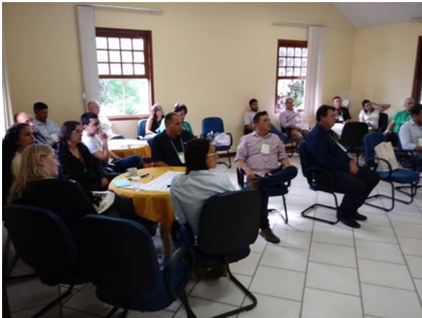
Figura 25. A discussão seguiu contínua a mesa de debate, havendo grande avanço. Como conclusão deste painel, os participantes salientaram a importância de uma lógica colaborativa entre as empresas.

Figura 26. O Word café permitiu que funcionários das áreas diferentes a tecnologia pudessem expor como a tecnologia e inovação também influenciam em suas atuações.