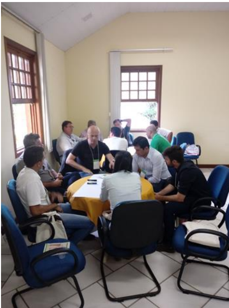
Figuras 23. Dinâmica do “World Café”, em que cada redator consolidou a discussão e os componentes contribuíram com as definições, enquanto outro tema era discutido em outra mesa.

Em seguida, foi realizada uma dinâmica “world café”, na qual os participantes separados em mesas discutiam sobre “como desenvolver tecnologias conjuntamente” e “como o governo pode promover tecnologias na siderurgia” (Figuras 23 a 26).