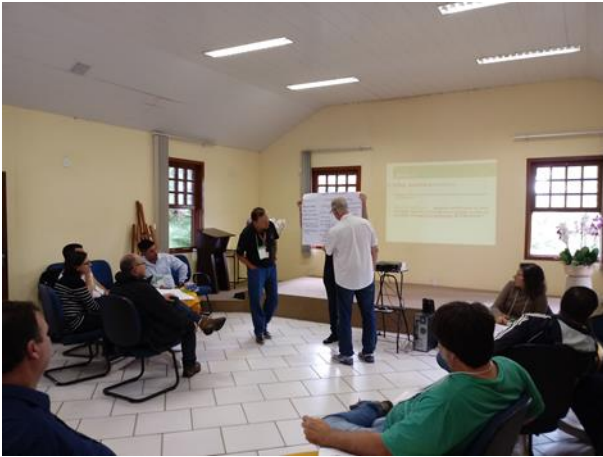
Figura 17. Atividade em grupo, em que os participantes construíram uma matriz de impactos ambientais para atividades fictícias relativas ao setor florestal e carvoaria.