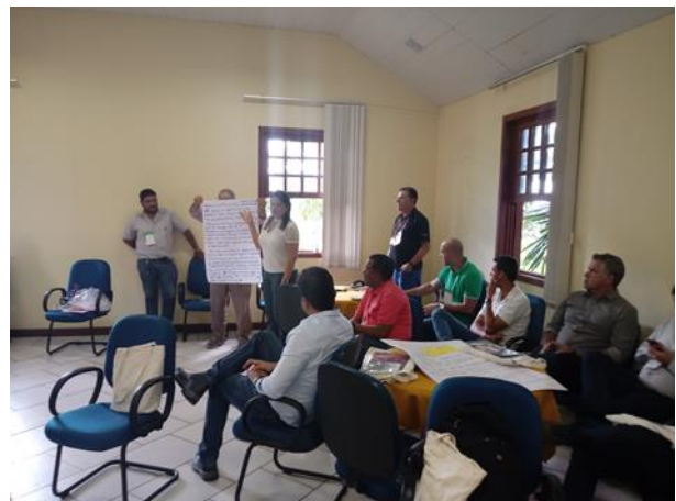
Figura 26. O Word café permitiu que funcionários das áreas diferentes a tecnologia pudessem expor como a tecnologia e inovação também influenciam em suas atuações.

Figura 25. A discussão seguiu contínua a mesa de debate, havendo grande avanço. Como conclusão deste painel, os participantes salientaram a importância de uma lógica colaborativa entre as empresas.