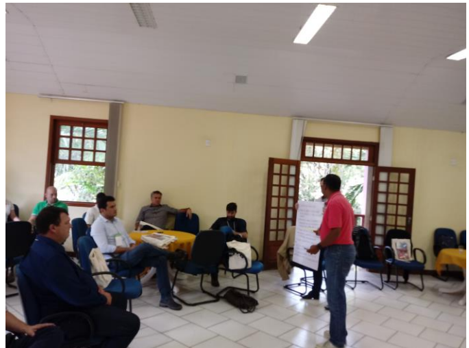
Figura 24. Em cada mesa um redator consolidou a discussão e os outros componentes contribuíram com as definições, sendo outro tema discutido em outra mesa. Os resultados consolidados pelo relator foi apresentado em plenária.