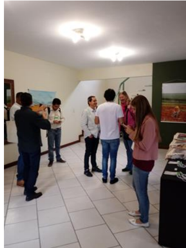
Figuras 1 e 2. Início do Primeiro dia do Workshop com um café de boas vindas aos participantes