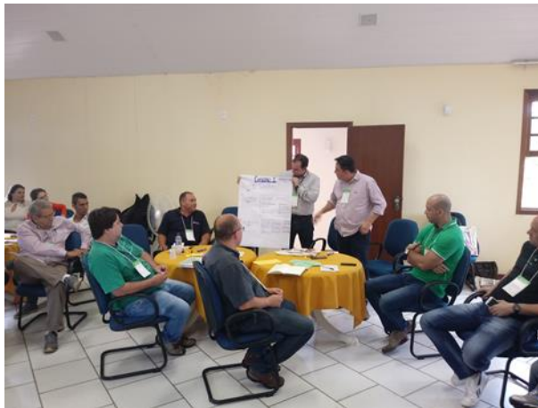
Figuras 20 e 21. Discussão dos grupos sobre as propostas elaboradas em função dos pontos selecionados da reforma trabalhista.

A atividade foi realizada foi participativa e permitiu uma discussão aprofundada do tema, desenvolvendo a mensagem que em muitas ocasiões o ganho individual não é equivalente ao melhor ganho coletivo.