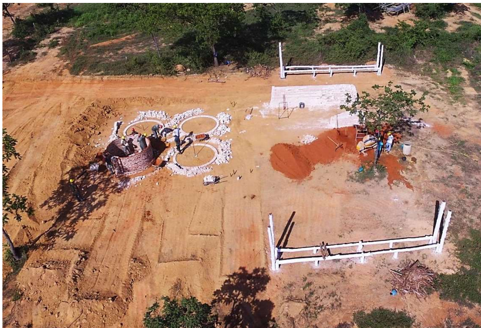
Figura 4 – Preparo da propriedade para o recebimento da unidade demonstrativa do projeto BRA/14/G31 – Siderurgia Sustentável.