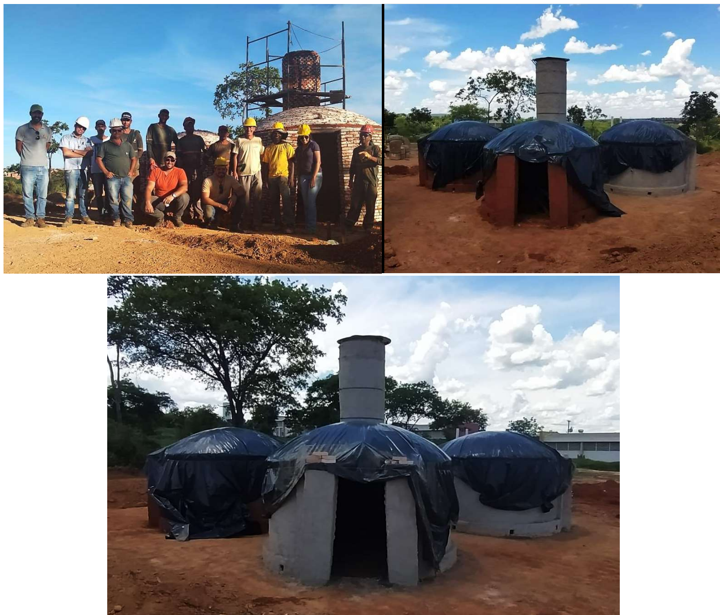
Figura 14. Quarto dia da construção do sistema fornos-fornalha do projeto BRA/14/G31 – Siderurgia Sustentável.

O site do Instituto de Ciências Agrárias – ICA/UFMG (Figura 15) e o do Gazeta Norte Mineira (Figura 16), publicaram matérias sobre a instalação desta unidade demonstrativa, bem como do curso de construção do sistema fornos-fornalha ofertado pela equipe do projeto BRA/14/G31 – Siderurgia Sustentável, demonstrando assim a importância e mobilização do presente projeto entre setores público, privado e academia, como objetivo de promover a adoção de tecnologias mais eficiente e sustentável para a produção de carvão vegetal.