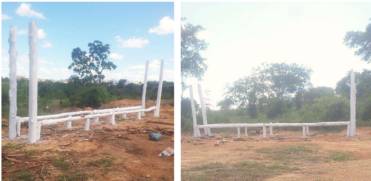
Figura 6 – Estrutura para o armazenamento de madeira e carvão vegetal do projeto BRA/14/G31 – Siderurgia Sustentável.