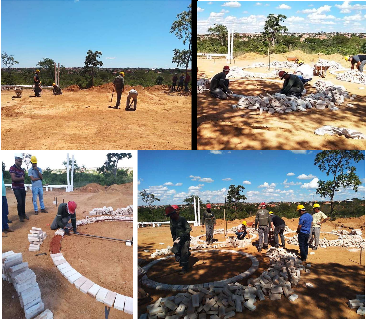
Figura 11. Primeiro dia da construção do sistema fornos-fornalha do projeto BRA/14/G31 – Siderurgia Sustentável.

A construção do sistema fornos-fornalha do projeto BRA/14/G31 – Siderurgia Sustentável, juntamente com o curso prático de construção do sistema fornos-fornalha, teve início no dia dezoito de dezembro de 2019. Durante o primeiro dia, ocorreu à demarcação da área e levantamento do primeiro forno (Figura 11).