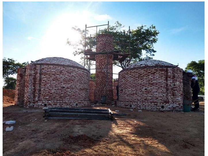
Figura 13. Terceiro dia da construção do sistema fornos-fornalha do projeto BRA/14/G31 – Siderurgia Sustentável.