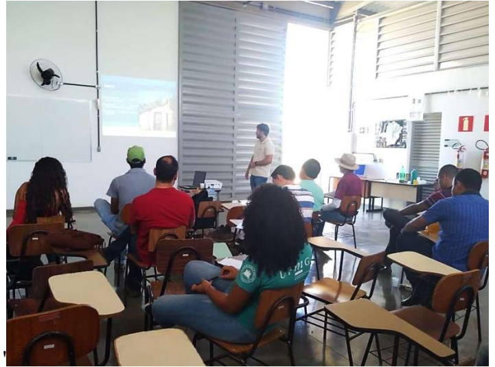
Figura 8. Apresentação do Projeto Siderurgia Sustentável durante o curso prático de construção do sistema fornos-fornalha.