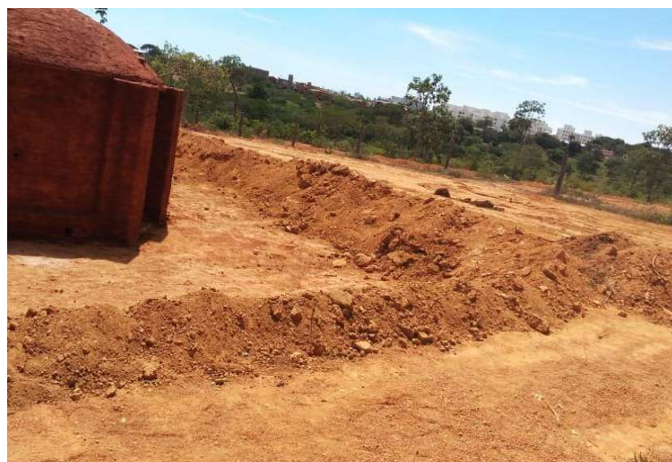
Figura 5 – Canaletas construídas ao redor da unidade do projeto BRA/14/G31 – Siderurgia Sustentável.

Além da limpeza da área destinada para a construção do sistema fornos-fornalha, foi mensurado e instalado um espaço com uma estrutura para o armazenamento da madeira e do carvão vegetal (Figura 6).