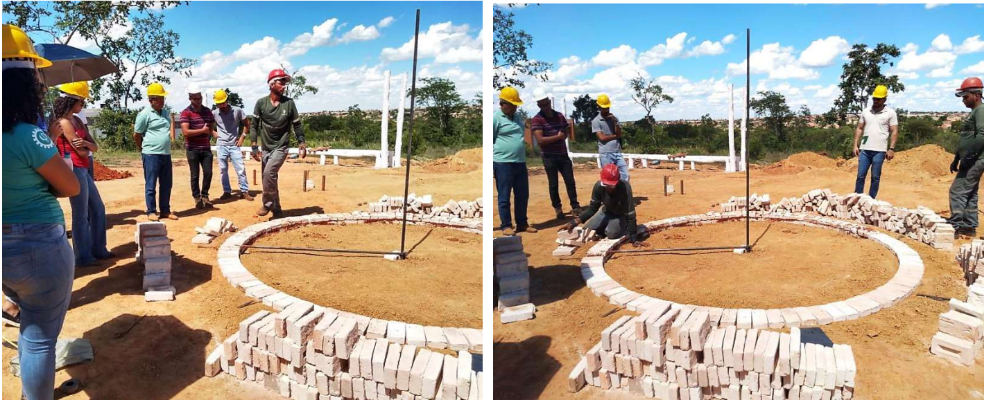
Figura 9. Acompanhamento da construção do sistema fornos-fornalha no Instituto de Ciências Agrárias – ICA/UFMG.

O curso contou com 15 participantes (Figura 10), sendo estes, docentes, discentes e técnicos do ICA/UFMG; discente da FUNORTE; representante da Emater e produtores e forneiros da mesorregião norte de Minas Gerais.