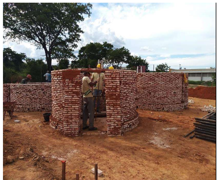
Figura 12. Segundo dia da construção do sistema fornos-fornalha do projeto BRA/14/G31 – Siderurgia Sustentável.