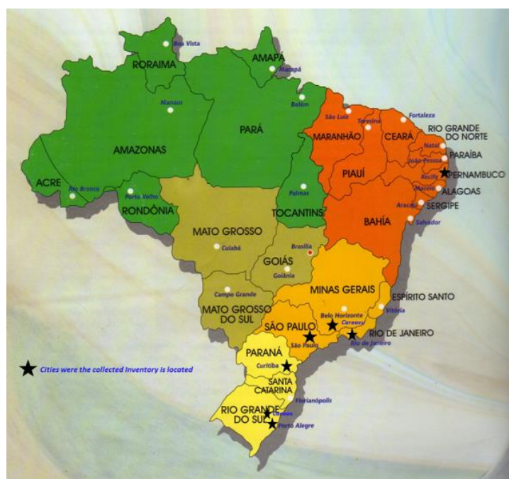
Fig. 1 – Mapa do inventário parcial de SDOs Recolhidas

Conforme destacado anteriormente, o transporte e a consolidação dos resíduos de SDO serão um dos grandes desafios para o projeto. A Figura 1 apresenta o mapa de distribuição de SDO armazenada, conforme inventário apresentado na Tabela 1.