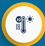
Ondas de Calor