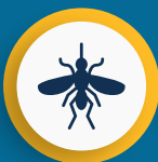
Proliferação de Vetores causadores de Doenças