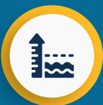
Elevação do Nível do Mar